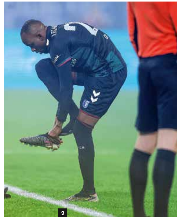
2_ Der schnelle Schuhwechsel auf dem Spielfeld ist auch während des laufenden Spiels erlaubt (Situation 3).

12: Abstoß; Verwarnung. Aufgrund der Vorteil-Anwendung liegt nun keine Verhinderung einer klaren Torchance vor – und